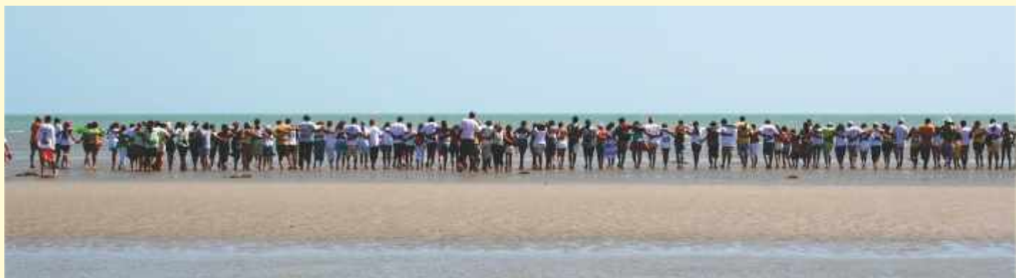
Abraço ao mar Tremembé.

Evidentemente que a questão da gestão não está resolvida, mas os problemas são parte do processo democrático para a construção de uma proposta inovadora. Neste caso, o grupo vai buscando a superação das dificuldades a partir de sua capacidade de organização. Atualmente, está circulando na Rede Tucum, uma proposta de sistematização dos procedimentos a serem adotados pelos membros da Rede, que afinal deverá ser mais um instrumento de apoio para o processo de gestão.