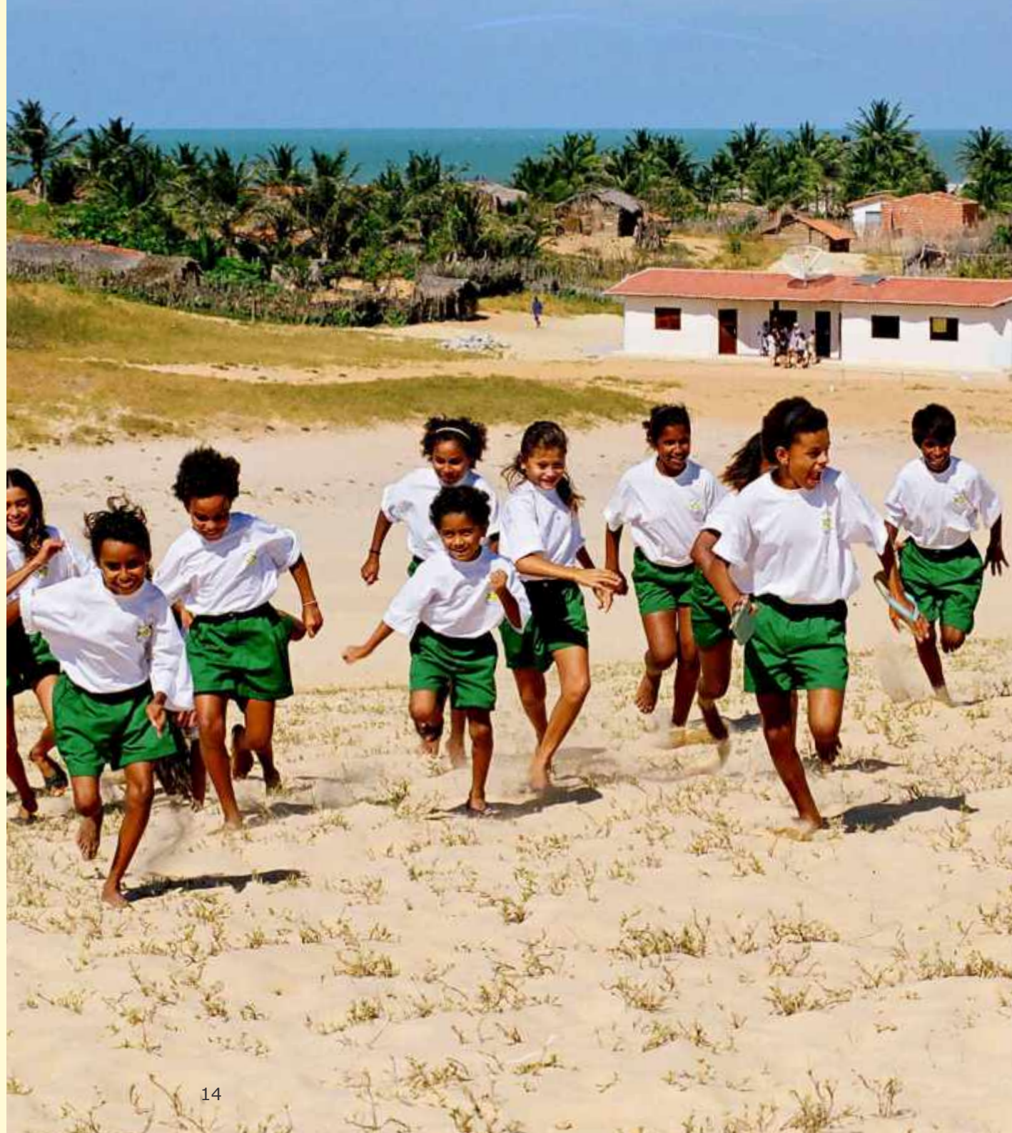
Coral da Prainha do Canto Verde.

E porque ainda temos muito a caminhar e interagir e com isso aprender, não situamos as questões aqui apresentadas como uma metodologia acabada, mas como questões que têm nos colocado em movimento, no pensamento e na ação, em busca da consolidação do turismo comunitário.